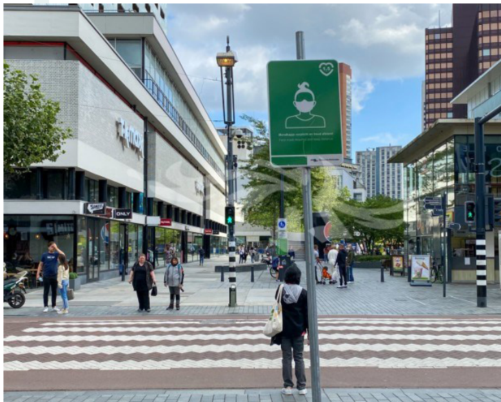
Bestuurlijke Hoofdpijnen Voorjaarsnota 2021

We zetten ons, samen met onze partners in de stad, met nieuwe energie in voor Rotterdam en alle Rotterdammers, in de buurten en wijken van de stad. Deze Voorjaarsnota legt daar de basis voor, met investeringen die de werkgelegenheid in kansrijke sectoren van onze economie stimuleren en bovenal investeringen in ons grootste kapitaal: de Rotterdammers. Hiermee willen we hoop en perspectief bieden, want samen gaan we Sterker Dóór. Daar hebben we vertrouwen in.