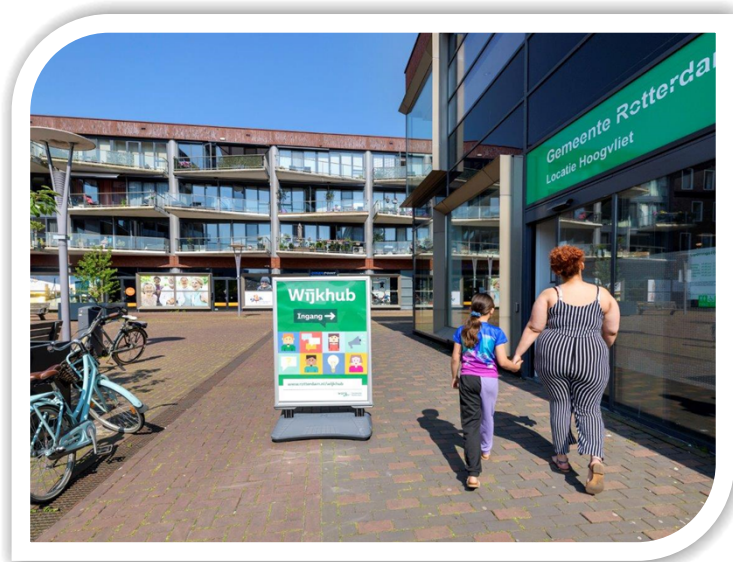
De tijdelijke Wijkhub

2.b. Er zijn verschillende bewonersbijeenkomsten gehouden in Hoogvliet, waarbij die in oktober over woningbouwplannen gecombineerd met een inventarisatie op thema over onderwerpen die in het JAP 2024 moesten komen en hele geslaagde was. Hier valt ook na 2023 nog een en ander aan te verbeteren, want in het algemeen voelt men zich toch vaak 'overvallen door nieuwe ontwikkelingen'. Daarom ook deze oproep: vraag graag aan de voorkant meer betrokkenheid van de wijkraad en via hen betrokkenheid van bewoners uit de verschillende buurten of op verschillende thema's in hun woonomgeving die mensen van belang vinden om over mee te denken. Meer meedenken en doen/meebeslissen op belangrijke onderwerpen voor Hoogvliet, minder alleen toehoren van wat er al voor 80 tot 100% besloten is. Wij roepen iedereen op die betrokken is bij Hoogvliet dit gezamenlijk te doen, faciliteren en op te pakken. En via verschillende kanalen bereikbaar te zijn voor mensen die vragen hebben of hulp zoeken.