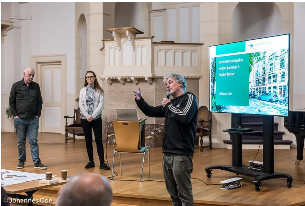
Participatieavond over het verkeerscirculatieplan