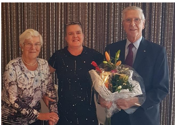
Bloemetje voor Jubilarissen