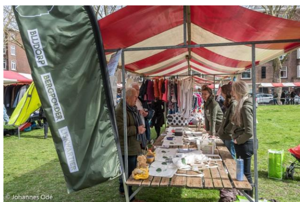
De wijkraad aanwezig op de Paasmarkt aan de Statenweg.