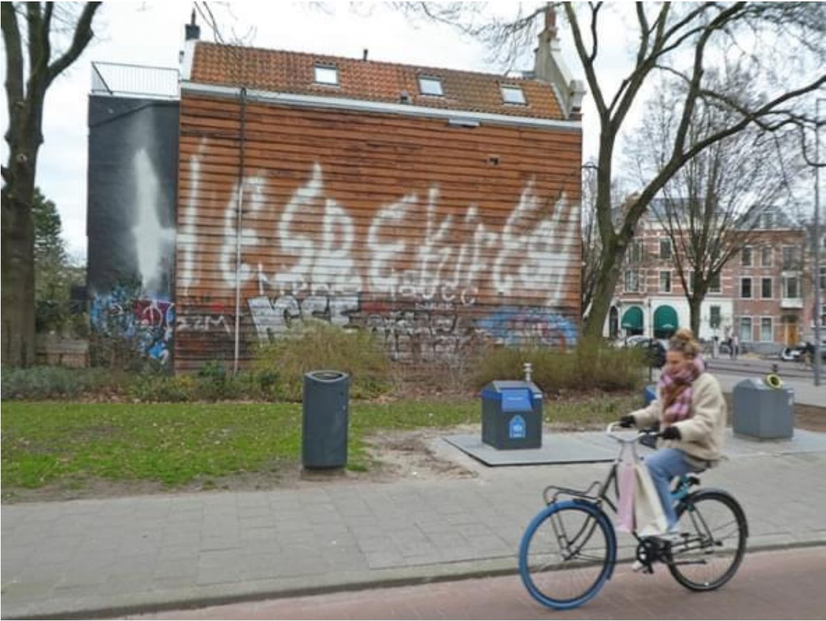
*de foto is de oude situatie, de muur wordt in 2024 voorzien van een mooie muurschildering