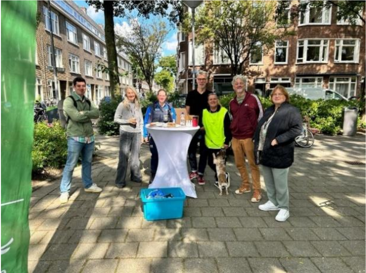
Klaar voor de Schouw in Bergpolder

Ook zijn wijkraadsleden aanwezig geweest bij verschillende openingen van bewonersinitiatieven. Zo ervaren ze wat er leeft in de buurt en of bewonersinitiatieven voorzien in een behoefte. Kortom hoe bewoners met elkaar de wijk nog leuker maken.