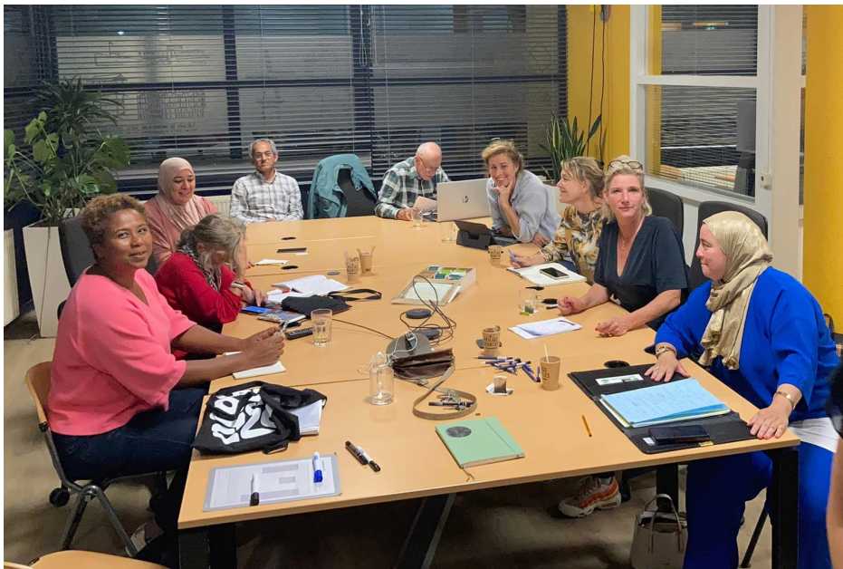
Wijkraadsleden in gesprek met bewoners en de gemeentelijke Ombudsman over energiearmoede

2) Over de energie-armoede . Samen met het Armoedeplatform is campagne gevoerd over de energietoeslag met een flyer over de energietoeslag en verwijzing naar alle spreekuren. Ook is op de markt gestaan door wijkraadsleden en milieucoaches met deze flyers en de mogelijkheden van huisbezoeken door milieucoaches. Ook is een gesprek van bezorgde bewoners met de ombudsman georganiseerd.