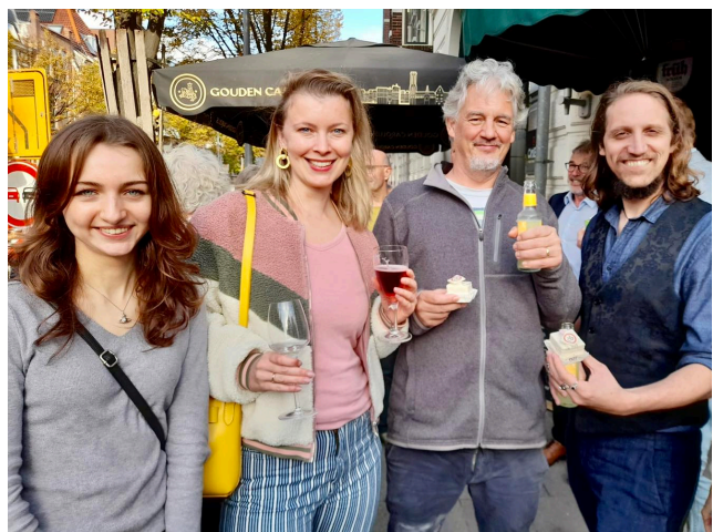
Opening herinrichting Walenburgerweg