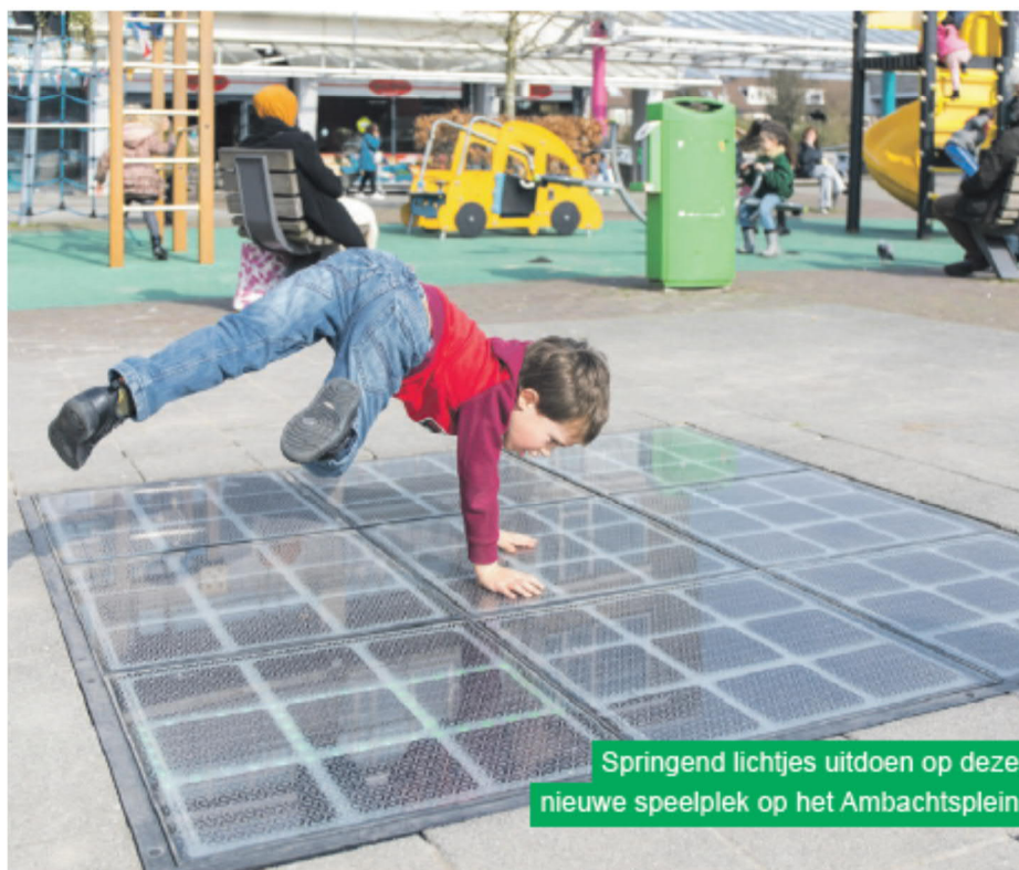
Springend lichtjes uitdoen op deze nieuwe speelplek op het Ambachtsplein

vierkantje verlicht in de tegel, spring dan één keer. Branden er twee lichtjes, spring dan twee keer, enzovoort. Pas wel op voor de rode vierkantjes, want wie daar op springt is af. Hoe de meeste punten te scoren? Door heel veel lichtjes uit te springen!