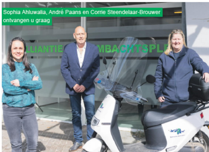
De Alliantie aan het Ambachtsplein

Medio december stuurden wij onze bewoners een ansichtkaart met onze nieuwjaarswensen en een uitnodiging om bewonersinitiatieven aan te vragen.