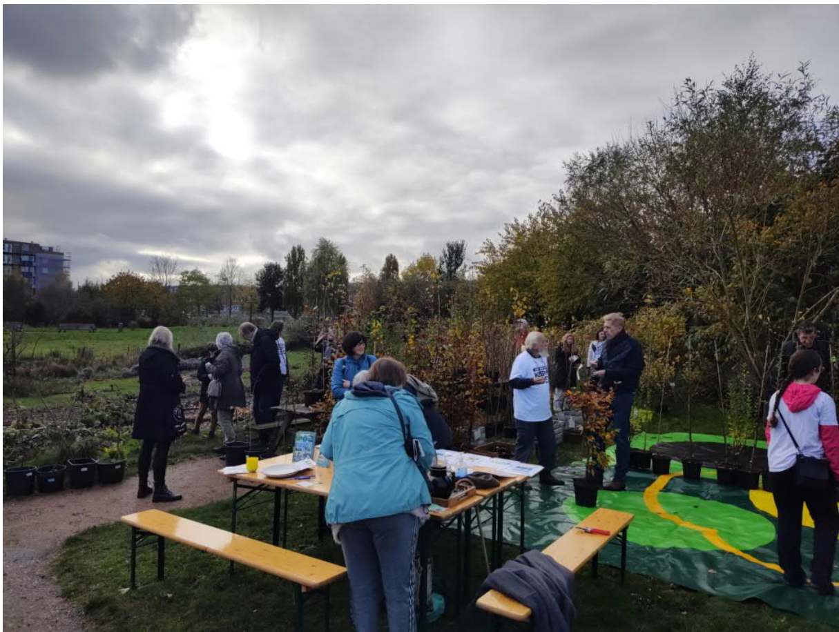
Wollefoppengroen en Co