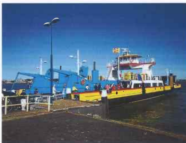
Ook op de veerpont wappert soms de Rozenburgse vlag. Deze veerdienst verzorgt de verbinding met Maassluis waar overgestapt kan worden op de metro 'Hoekse Lijn'. Naar Rotterdam een reis van vijf tot zes kwartier.