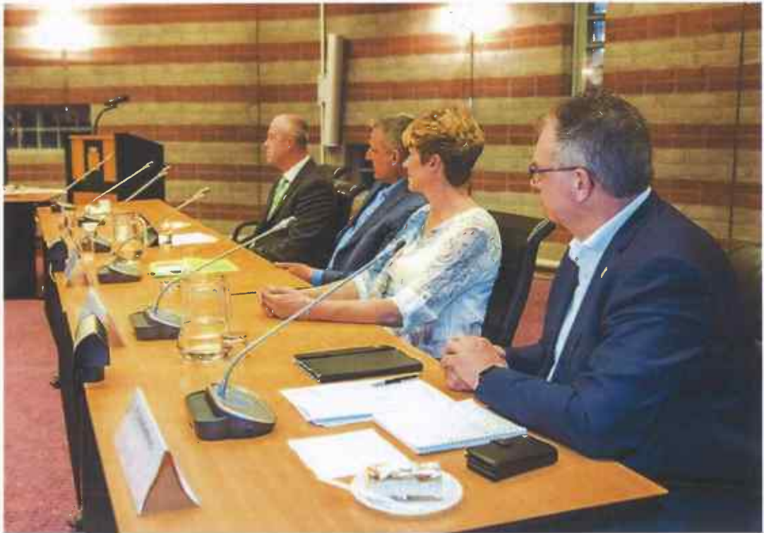
Fysiek vergaderen. Tot februari 2020 vanzelfsprekendheid. In 2021 kon de Gebiedscommissie drie keer fysiek vergaderen.

Het wijkactieplan 2021 is tot stand gekomen door een integrale aanpak van de verschillende clusters om te kijken hoe wij aan de prioriteiten van de Wijkagenda invulling kunnen geven.