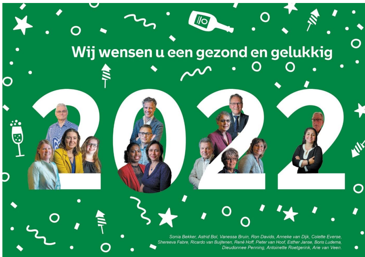
Afbeelding: kerstkaart gebiedscommissie