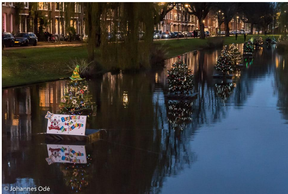
Een jaarlijks terugkerend initiatief: de kerstbomen in de bergsingel

De wijkraad beschikt over een budget voor participatie, bewonersinitiatieven en representatie. Hiermee honoreren zij bewonersinitiatieven, maar ook wanneer aan de orde, geven zij een bijdrage aan andersoortige initiatieven ten goede van de wijk.