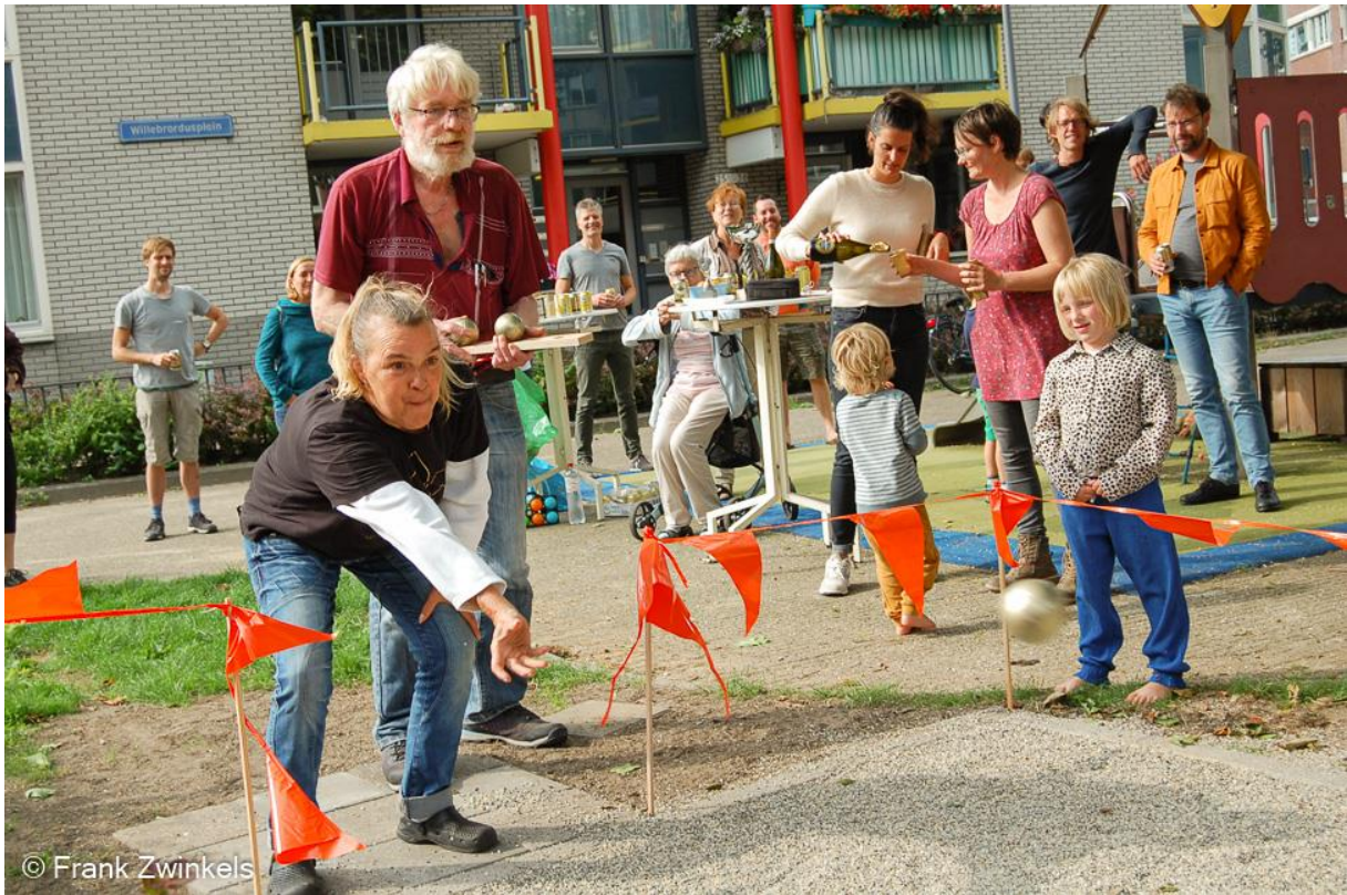
De jeu de boulesbaan op het Willebrordusplein