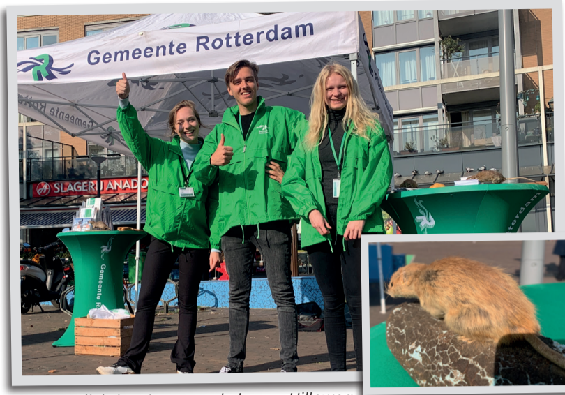
Het voorlichtingsteam op de Lange Hilleweg

Naast de mogelijkheid om online de vragenlijst via de app in te vullen hebben we ook een aantal momenten gehad dat mensen langs konden komen om de vragenlijst handmatig in te vullen. Van deze mogelijkheid hebben uiteindelijk 41 mensen gebruik gemaakt. Dat was een aantal dat iedereen toch wel verraste. Digitaal waren er ook nog eens 311 deelnemers. De resultaten zijn duidelijk: het overgrote deel van de deelnemers heeft overlast van ratten (11% van de deelnemers zegt geen overlast van ratten te hebben, maar ze wel met enige regelmaat te zien). Bij de opmerkingen werd 291 keer een locatie genoemd waar men overlast van ratten