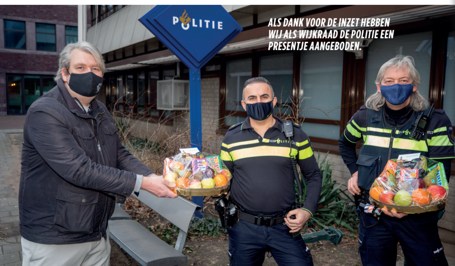
ALS DANK VOOR DE INZET HEBBEN WIJ ALS WIJKRAAD DE POLITIE EEN PRESENTJE AANGEBODEN.

Bij het advies over de horecanota dat door de gemeente aan ons gevraagd werd hebben we aandacht gevraagd voor een aantal plekken waar sprake is van structurele overlast. Maar ook daar loopt men dan weer tegen het verhaal van tekort aan handhaving, in dit geval van de DCMR (Dienst centraal milieubeheer Rijnmond), aan.