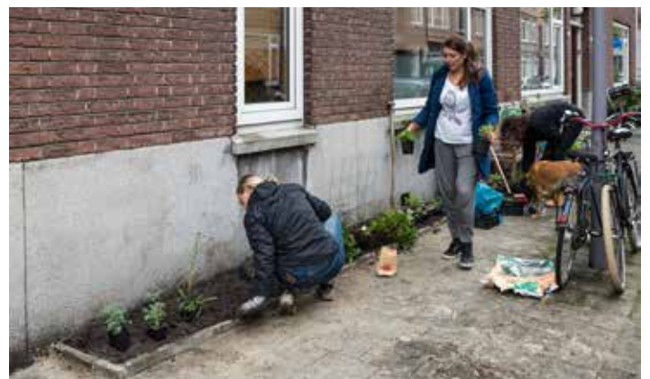
Geveltuintuin aanleg Blijdorp