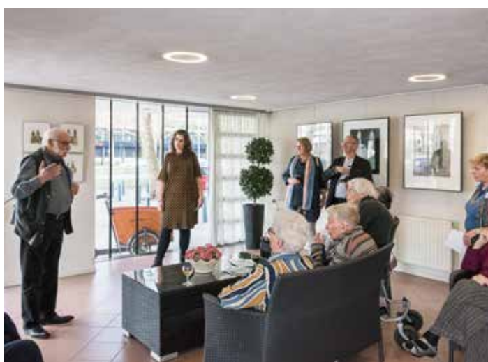
Culturele Huiskamer Emmahuis