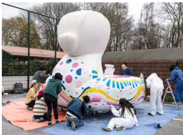
Nieuw jasje voor het Badkonijn