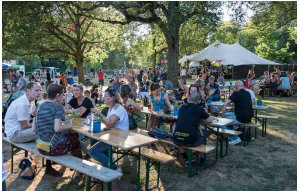
Duizel in het park

Op meer plekken in de wijk ervaren bewoners verkeersoverlast en onveiligheid. Dankzij een breed gedragen bewonerspetitie is de onveiligheid door te hard rijdende automobilisten op de Bergweg – Walenburgerweg – Bentincklaan aangekaart en er ligt een