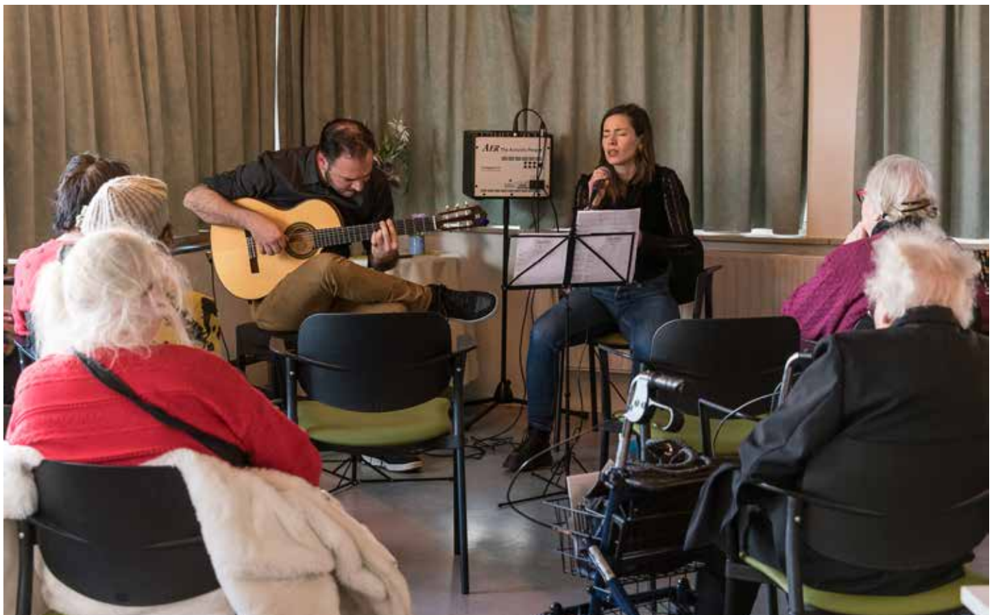
Bewonersinitiatief Kunst en Muziek in het Emmahuis