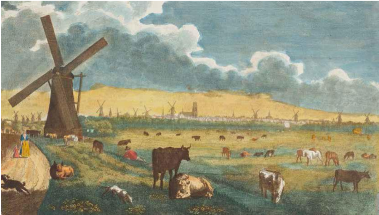
Rotterdam vanaf de Schie gezien met rechts de Blijdorpse Polder 1781

Tekening: Collectie Stadsarchief Rotterdam, NL-RtSA_4080_1973-4323 (Jacob Groenendijk)