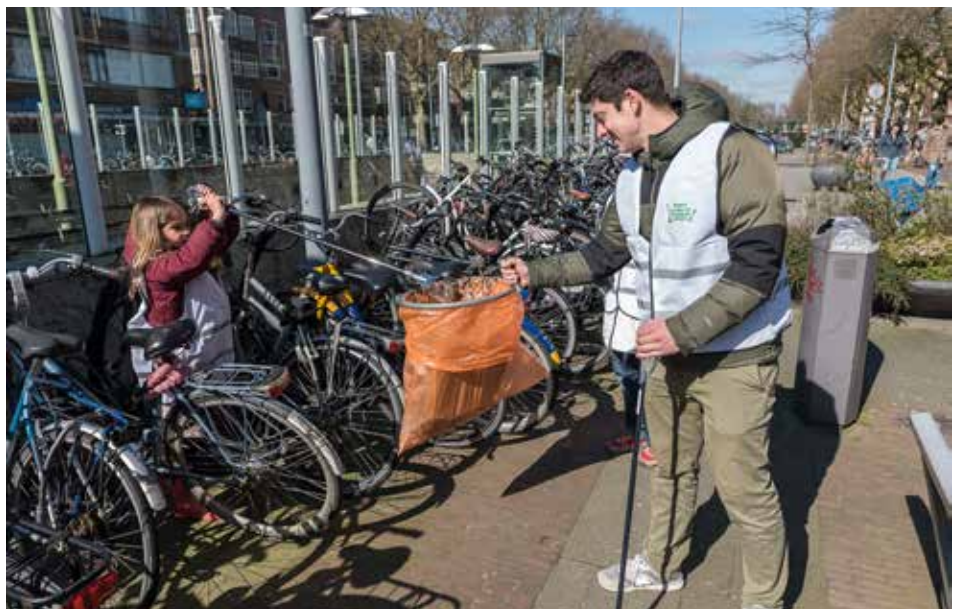
Rotterdam Noord Schoon

De wijkraad komt niet altijd zelf in actie, maar brengt aandachtspunten van bewoners onder de aandacht van de politiek. Bovendien steunen ze bewoners die hun zegje willen doen bij de gemeente via inspraakrecht. Een mooi resultaat van de samenwerking met alle partijen zijn de verbrede en sterk verbeterde fietspaden die vanuit Park Zestienhoven door Blijdorp naar Centraal Station gaan en de herinrichting van de Schepenstraat als voorbeeld voor behoud van groen via Right to Challenge .