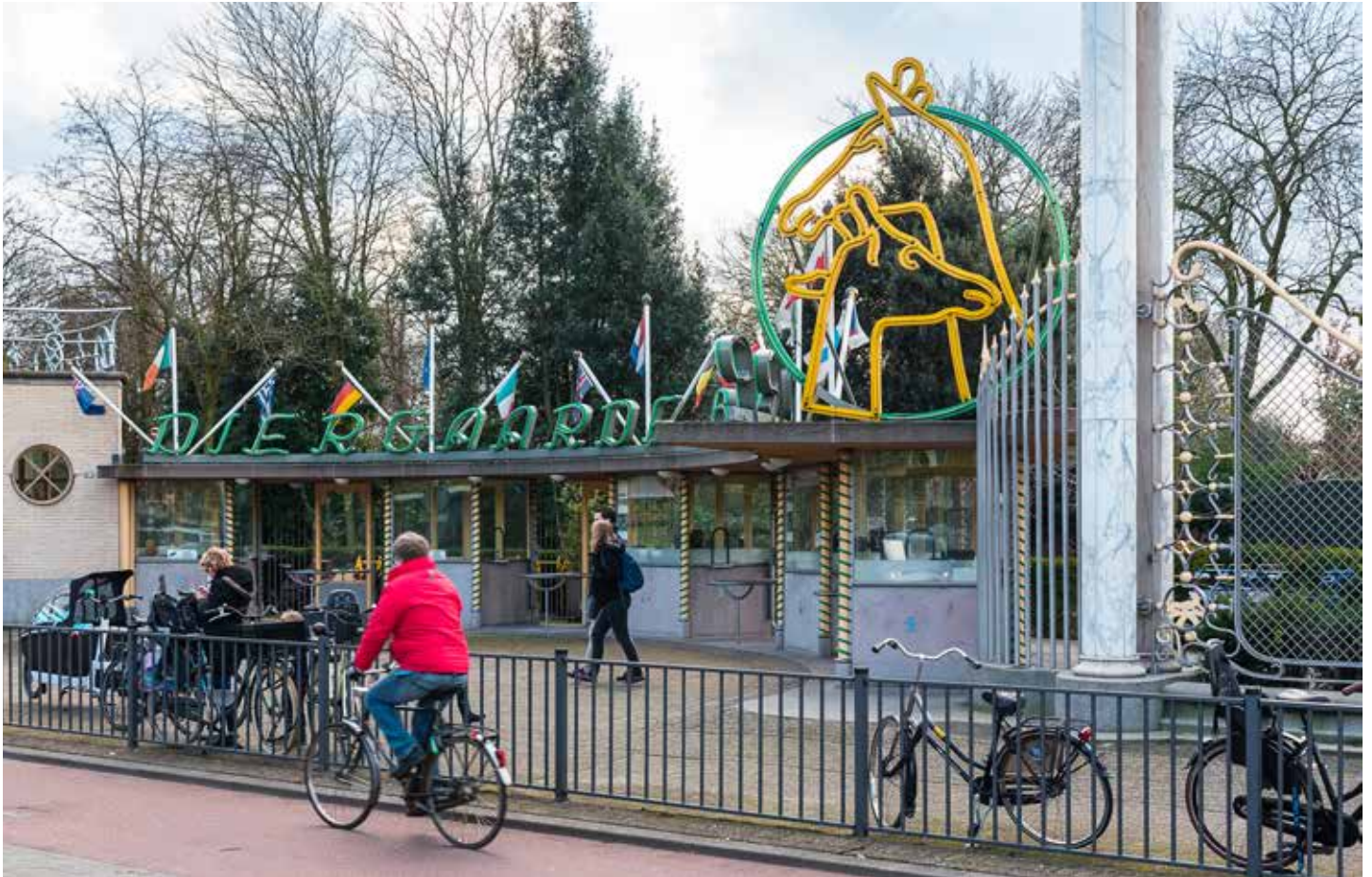
Ingang Diergaarde Blijdorp aan de Van Aerssenlaan

De wijkraad geeft graag mee dat wonen nabij voorzieningen een wijk aantrekkelijk maakt.