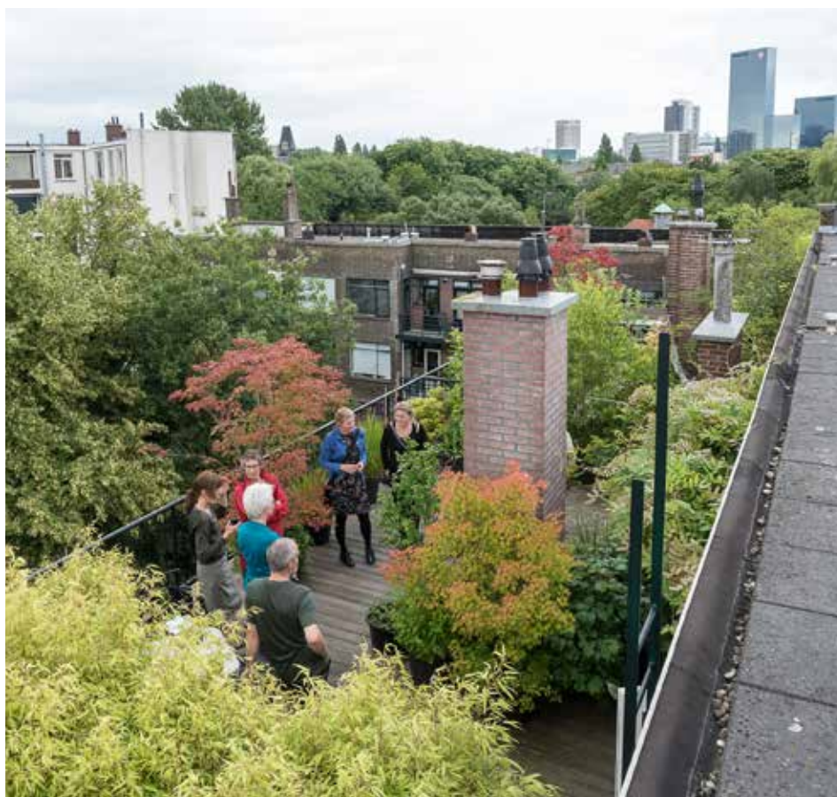
.De Groene Excursie