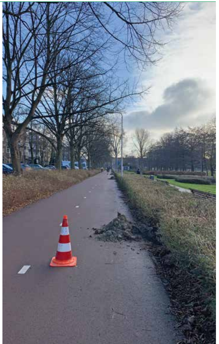
De nieuwe verlichting langs het Vroesepad wordt aangelegd