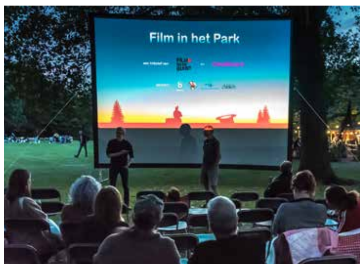
Film in het Park