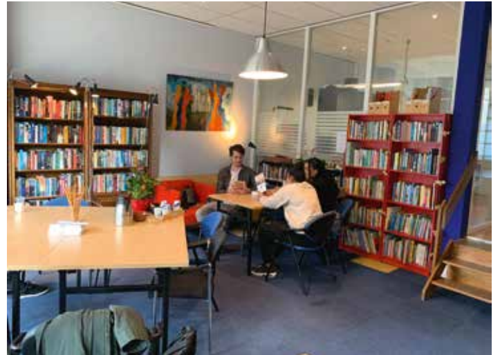
SOL in De Huiskamer

Blijdorpnieuws is een initiatief van een aantal betrokken bewoners die zijn verenigd in stichting Wijkmedia Blijdorp.