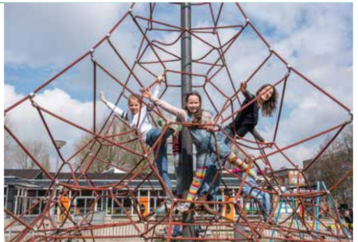
Blick in de wijk