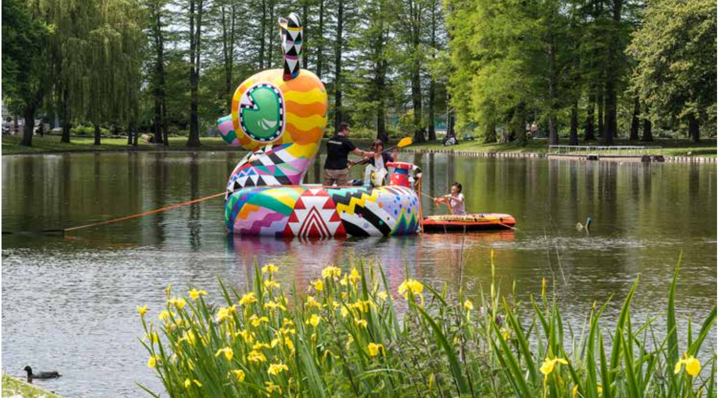
Nieuw jasje Badkonijn