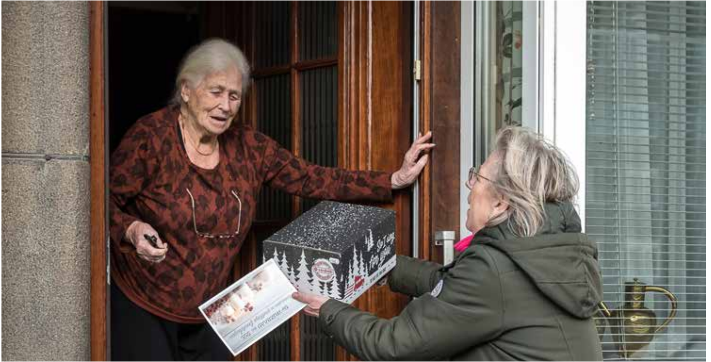
SOL deelt kerstpakketten uit