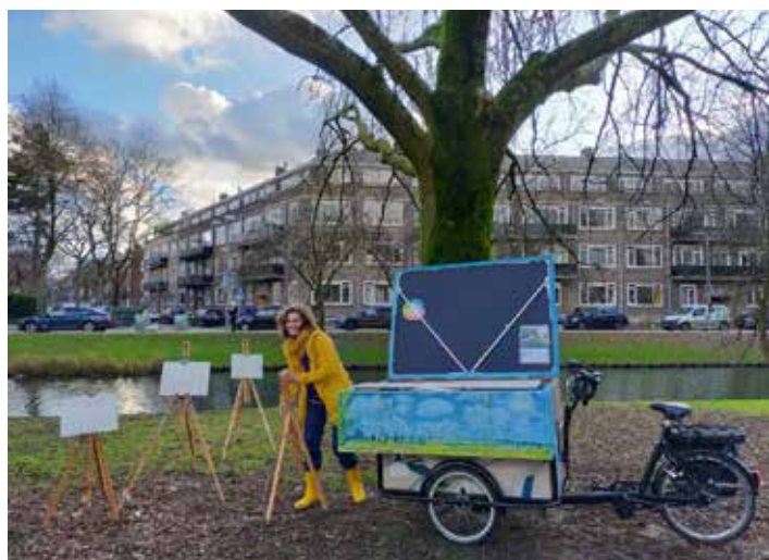
Atelier op Wielen