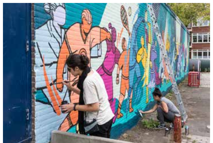
Muurschildering van Vlooswijkstraat