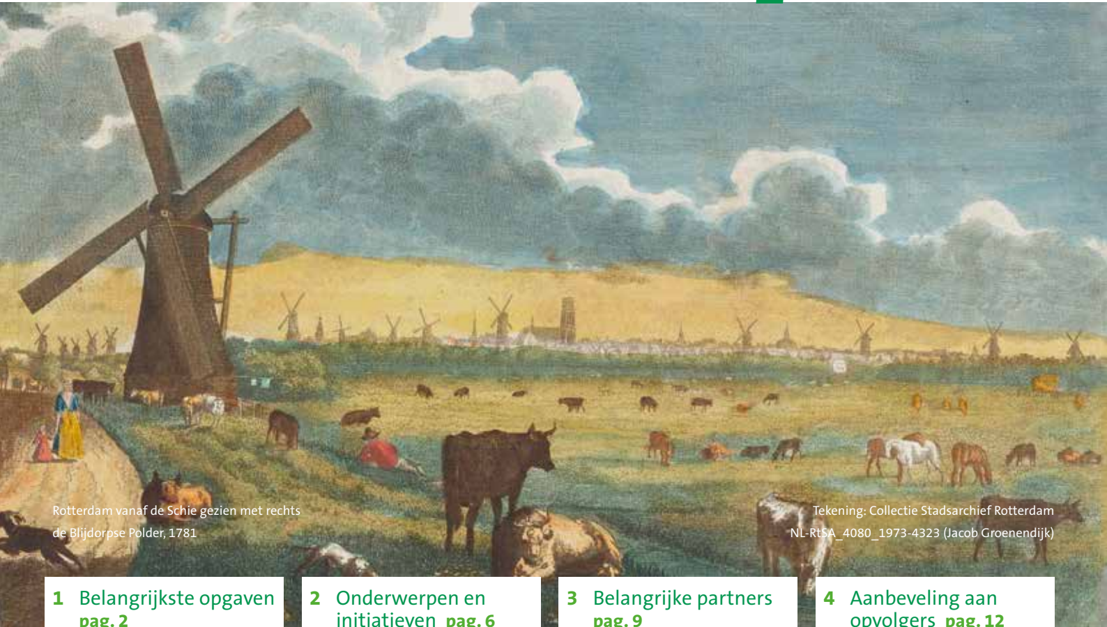
Rotterdam vanaf de Schie gezien met rechts de Blijdorpse Polder, 1781

Overdrachtsdocument Wijkraad Blijdorp en Blijdorpse polder