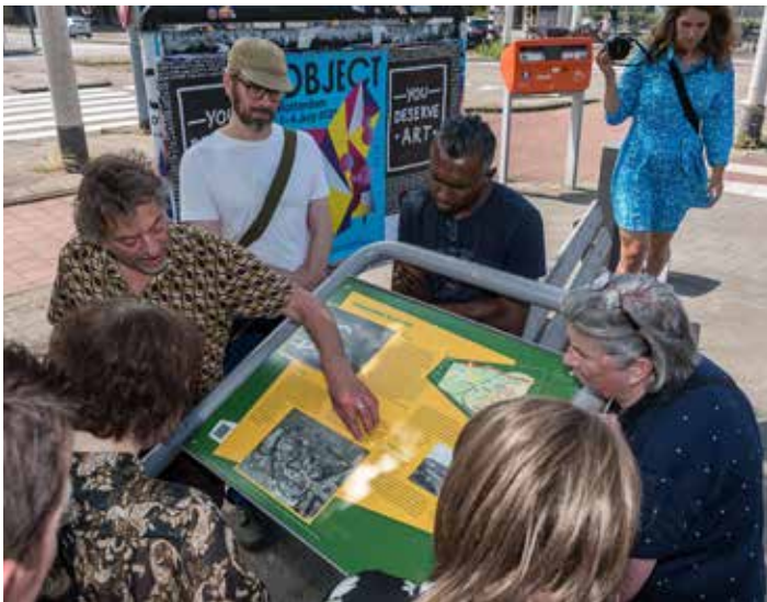
De eerste wandeling langs het Buitenmuseum

Leefbaarheid in de wijk wordt overigens niet alleen gedictieerd door veiligheid. Kunst en cultuur in de wijk en kennis over de geschiedenis van de wijk, zijn minstens even belangrijk. Het Buitenmuseum dat in 2021 gerealiseerd werd is hier een goed voorbeeld van. Dit bewonersinitiatief is door een hecht clubje Blijdorpers met veel liefde vormgegeven. Er is gedegen onderzoek gedaan naar de historische wetenswaardigheden van de wijk, welke gedeeld wordt via interessante panelen die door de hele wijk op de betreffende locaties geplaatst zijn. De panelen worden bijzonder goed gelezen door passanten. Ook is er een boekje uitgegeven dat de hele route beschrijft in een wandeling van anderhalf uur.