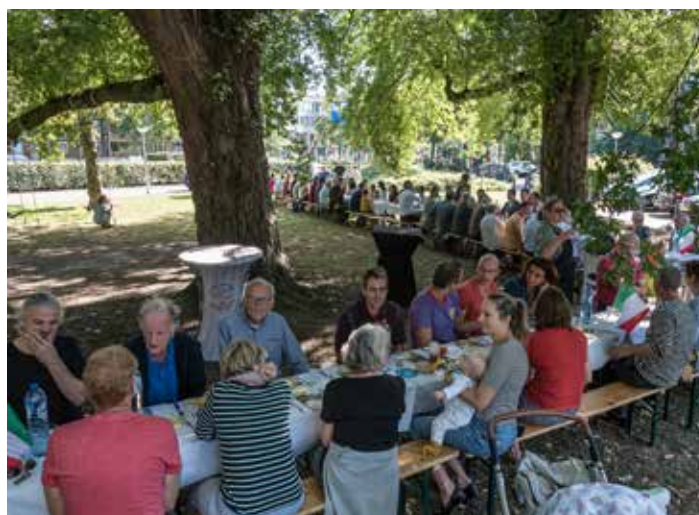
De lange lunchtafels der verbinding