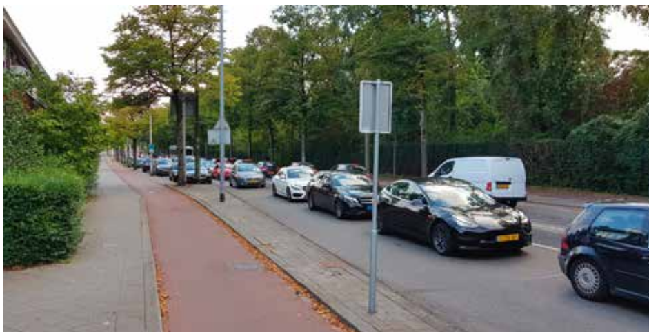
Toenemend verkeer aan de Van Aerssenlaan

In het park is bij een deel van de bewoners ook een wens voor verlichting. Dan gaat