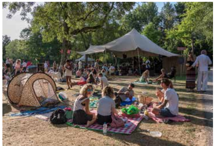
Duizel in het Park