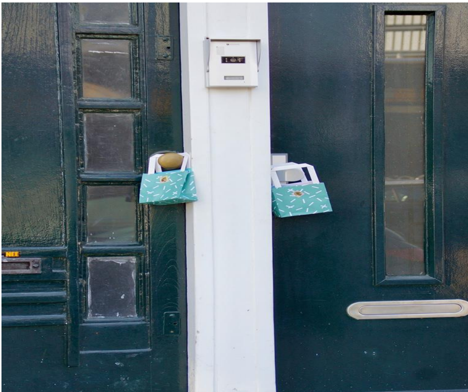
Je burens verrassen in Coronatijd