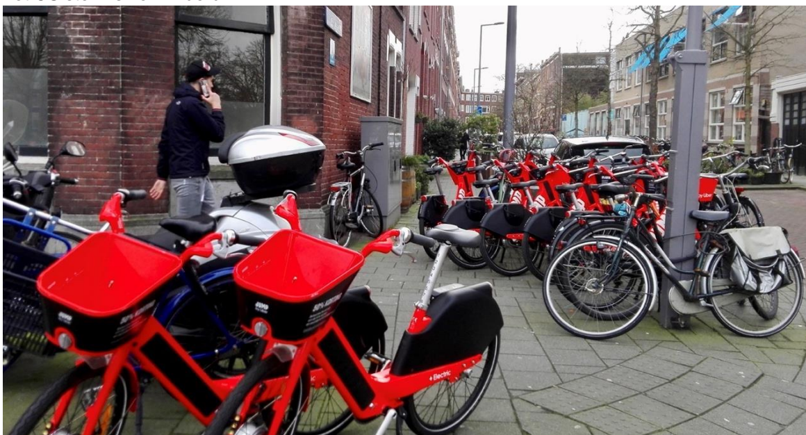
Overlast van deelfoertuigen op straat

Het gebruik van e-deelfietsen en -scooters is toegenomen, wat positief is voor de luchtkwaliteit. In 2020 is de overlast van foutgeparkeerde voertuigen in de loop van het jaar verminderd. Dit heeft deels te maken met de uitbreiding van de fietsenstalling aan de noordzijde van het Centraal Station (CS). Wat ook een belangrijke rol heeft gespeeld, is het feit dat door Corona het aantal reizigers van en naar het CS sterk is verminderd.