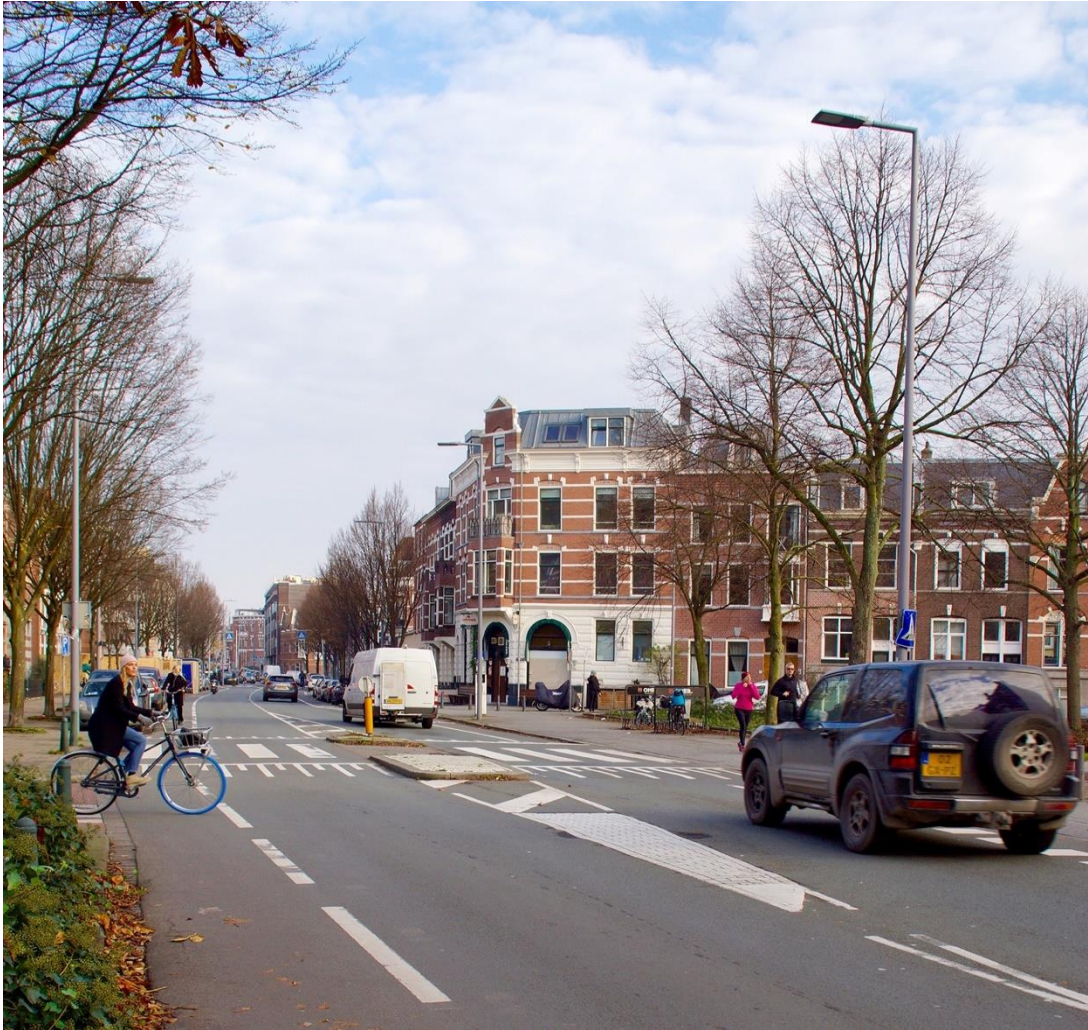
Walenburgerweg: zebra ter hoogte van de Spoorsingel

De verkeersveiligheid is het afgelopen jaar minder in het geding geweest. Dit heeft vooral te maken met de Coronamaatregelen: er komt veel minder verkeer door de wijk. De scholen zijn langdurig gesloten en daarmee is er weinig fietsverkeer over bijvoorbeeld de Walenburgerweg en de Spoorsingel. Dit is echter geen structurele oplossing voor de verkeersveiligheid. Deze zien wij wel in het veiliger maken van de Walenburgerweg. Hier pleiten wij al jaren voor. Gelukkig hebben wij begin 2021 te horen gekregen dat deze nu de aandacht van de gemeente heeft. In 2021 wordt een plan gewerkt en hopelijk wordt dit nog in 2021 uitgevoerd.