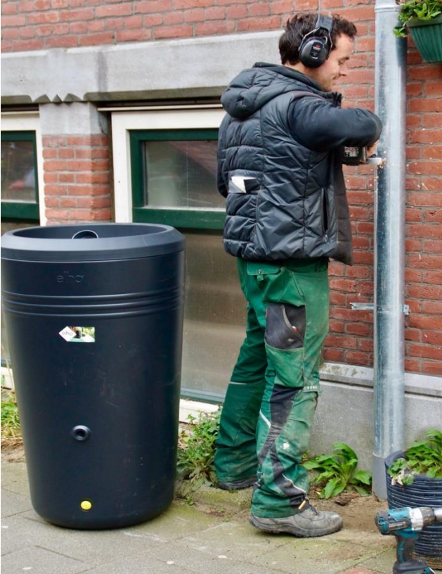
Bewonersinitiatief opvang regenwater