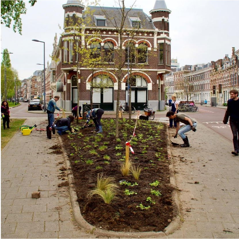
Bewonersinitiatief voor vergroenen van de wijk