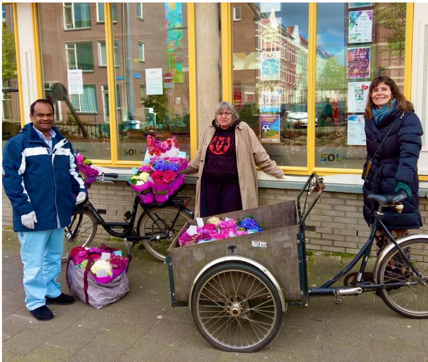
Vrijwilligers en wijkraadsleden brengen hortensia's naar 75-plussers

Andere initiatieven gingen over de buitenruimte. Bewoners waren vaker thuis en hadden zo ook meer oog voor hun buurt. Bewoners aan de Sporsingel (westzijde) hebben geld gekregen voor een grote plantenbak, waarin de zonnebloemen het geweldig deden. En samen met 'Stad in de maak' hebben ze extra afvalbakken ontworpen die ze zelf schoonhouden. Een ander mooi project van bewoners is de realisatie van meer groen in de Waerschutstraat. En niet te vergeten het in eigen beheer nemen van de groene driehoek op de hoek van het Proveniersplein. Het initiatief 'lente in de Heultuin' is in verband met corona verschoven naar een later tijdstip. Kinderen uit de buurt hebben samen met bewoners, volgens de toen heersende regels, de moestuinbakken onder handen genomen. Dankzij het prachtige weer kon binnen een maand de groente worden geoogst. Het budget dat niet is uitgegeven mogen we meenemen naar 2021.