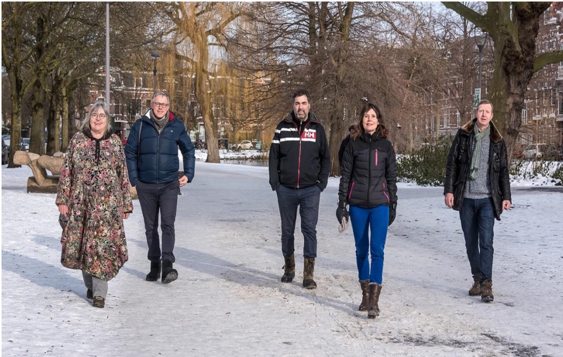
Coronaproef op de foto