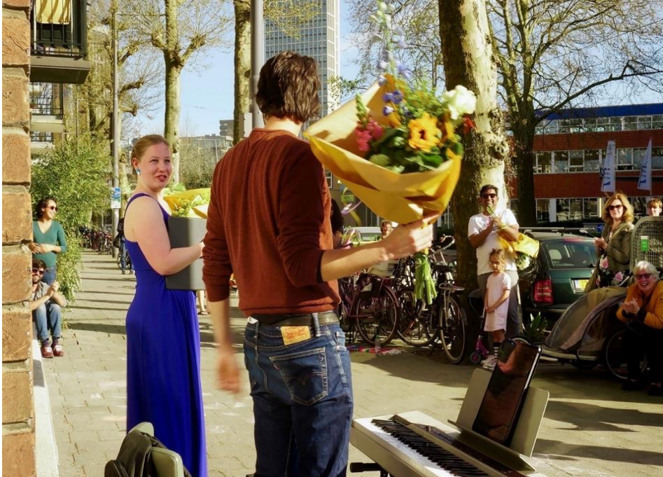
Je burens blij maken in Coronatijd

In de afgelopen jaren heeft de Wijkraad hier sterk aan gewerkt door onder andere veel bewonersinitiatieven toe te kennen. In het afgelopen jaar konden de meeste activiteiten echter geen doorgang vinden vanwege de Coronamaatregelen. Maar we hebben ook gezien dat juist door Corona allerlei initiatieven ontstonden waarbij bewoners werden geholpen met bijvoorbeeld boodschappen doen en van maaltijden werden voorzien.