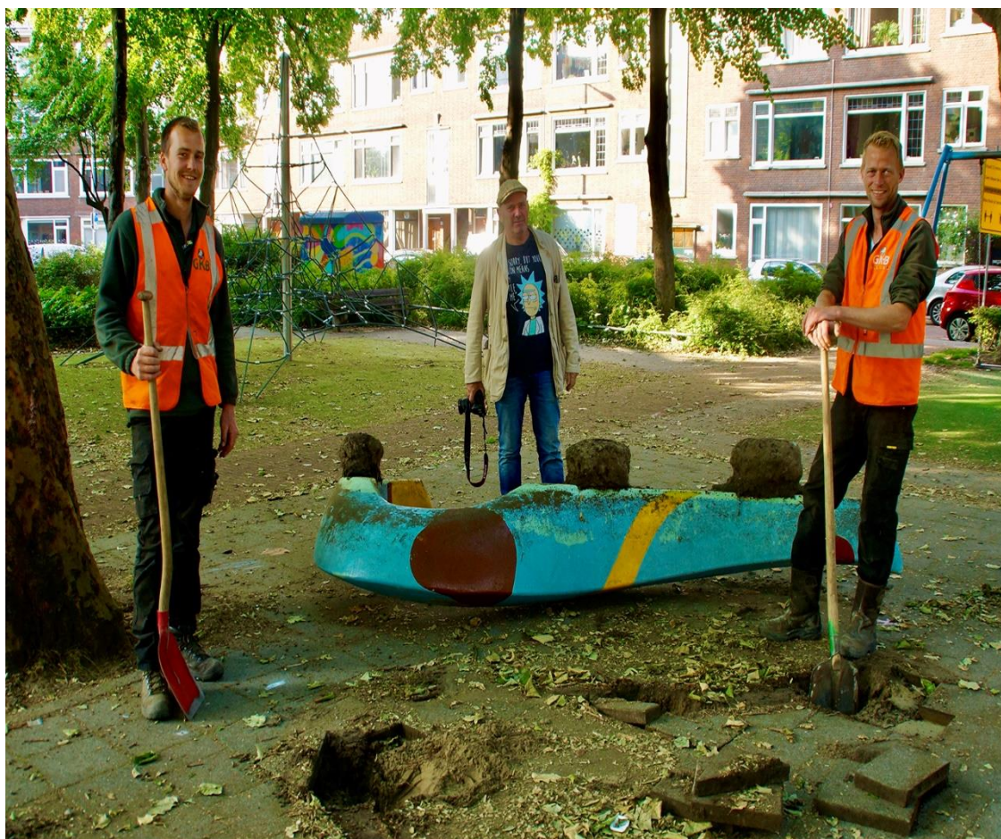
Bewonersinitiatief opknappen kunstwerk Baljuwplein