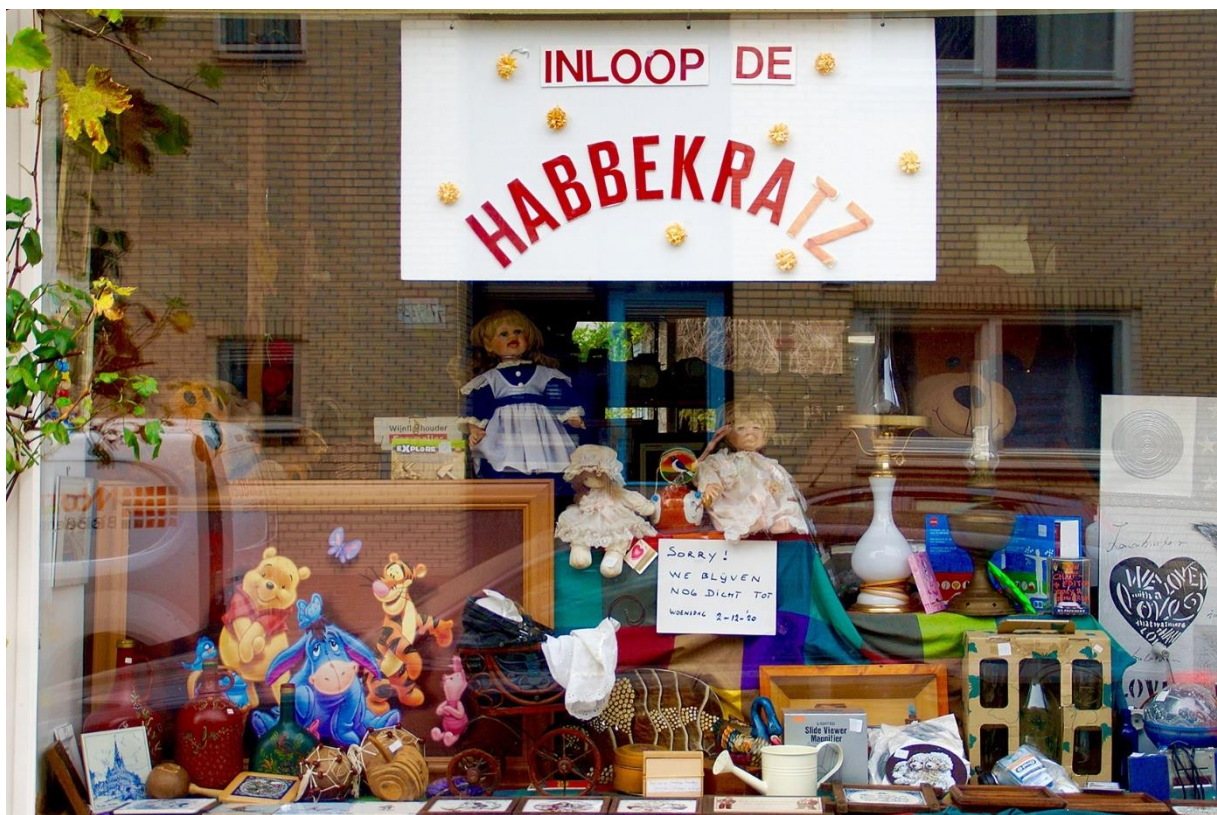
Verduurzamen van de wijk