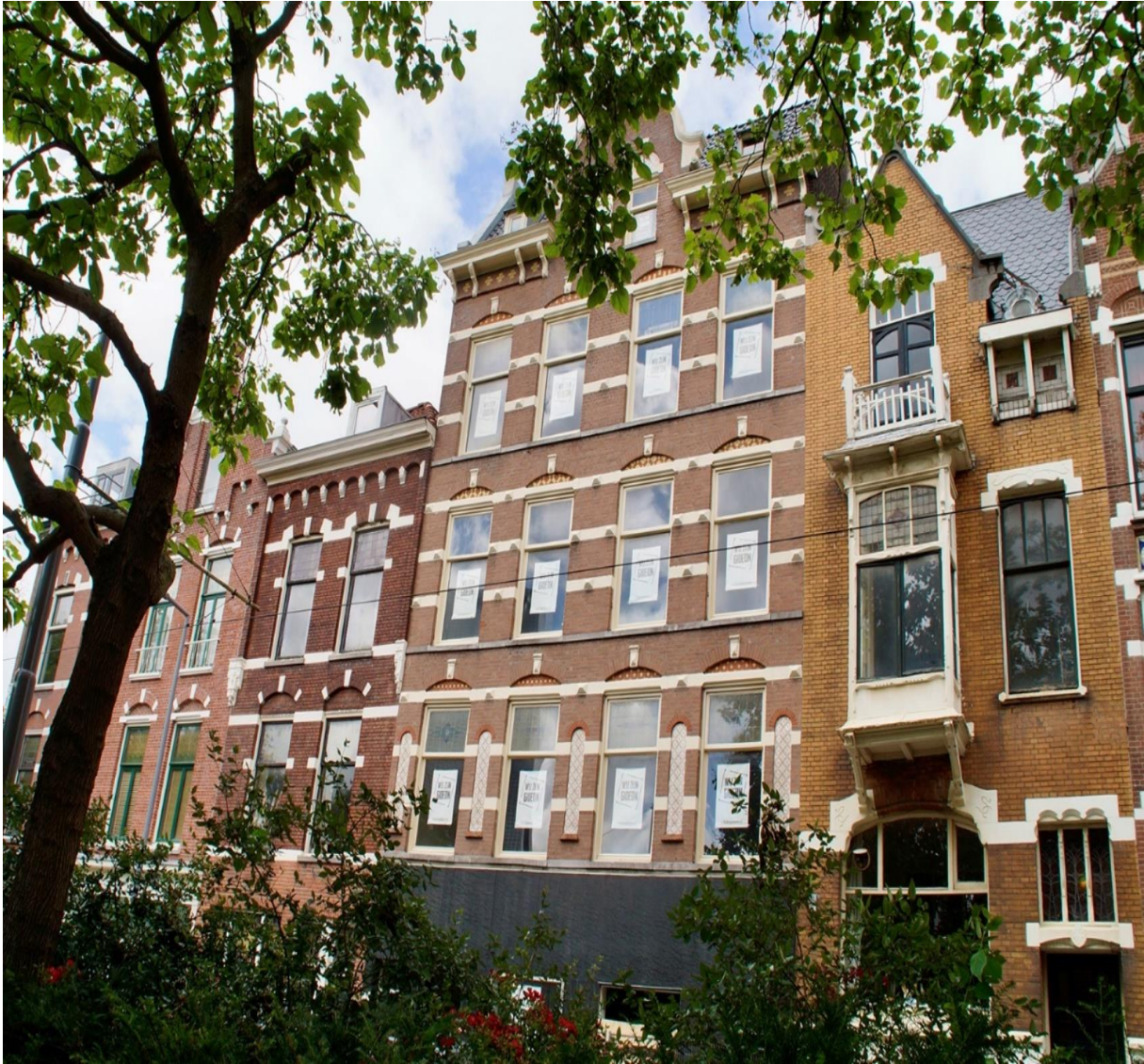
Verkamering van mooie panden

Een tweede dreiging voor de leefbaarheid vormt de toenemende verkamering van de veelal mooie grote panden langs de singels. Leeggekomen panden worden omgebouwd tot kleinere wooneenheden. En ook kleinere panden in de zijstraten, met name in de Hoevebuurt, worden opgekocht en verkamerd. In sommige gevallen wordt hiervoor een vergunning gegeven, maar in veel gevallen niet. Deze verkamering heeft behalve voor de monumentale panden, er wordt geen rekening gehouden met beschermd stadsgezicht, ook voor de buitenruimte gevolgen: parkeerdruk neemt toe, vervuiling neemt toe en ook zien we meer fietsen op de stoepen geparkeerd. Over deze punten hebben wij een advies geschreven aan het college (samen met de andere wijkraden in Noord).