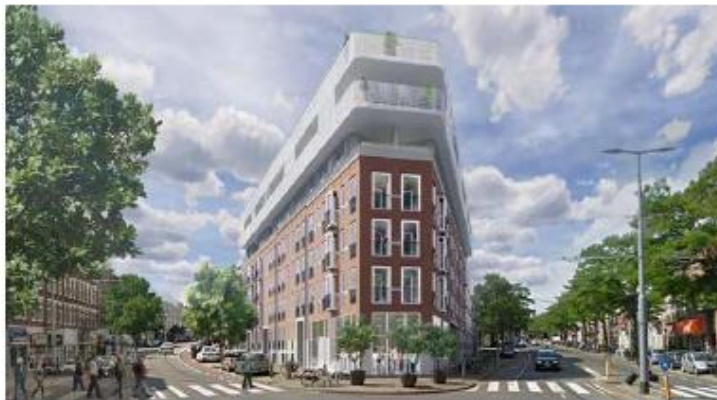
Impressie nieuwbouwwoningen locatie voormalig Correct.