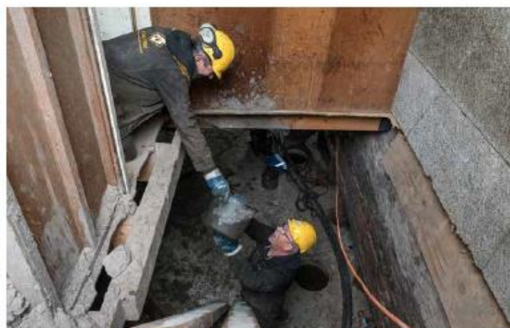
De funderingswerkzaamheden in het Oude Noorden Noord zijn volop aan de gang.