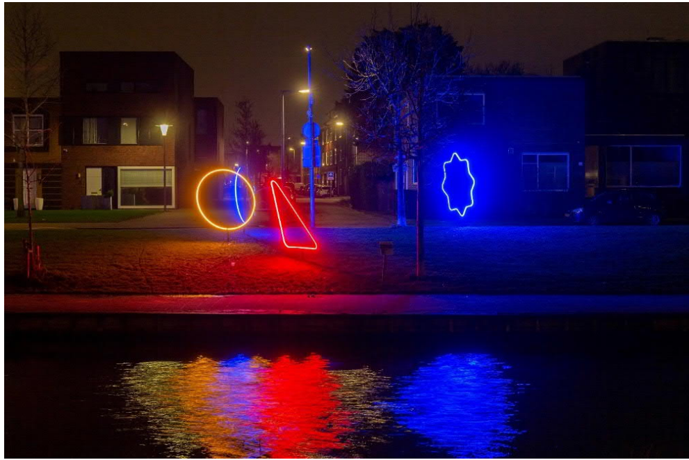
Lichtkunstwerken Lepelaarsingel