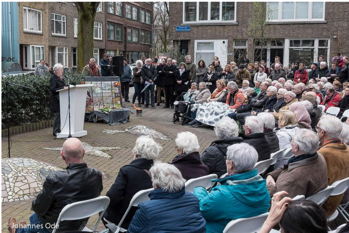
Bijeenkomst initiatief realisatie oorlogsmonument Treubstraat.

Ook in 2019 zijn er weer voldoende bewonersinitiatieven ingediend. Er zijn veel aanvragen in het kader van jeugd- en kinderactiviteiten. Ook vergroening, schoon in de buitenruimte en diverse kunst en cultuur aanvragen maken onderdeel uit van de initiatieven. Een belangrijk initiatief is het realiseren van een oorlogsmonument in de Treubstraat. Dit door bewoners ontwikkelde initiatief is erkend door de stad en zal in 2020 worden geplaatst.