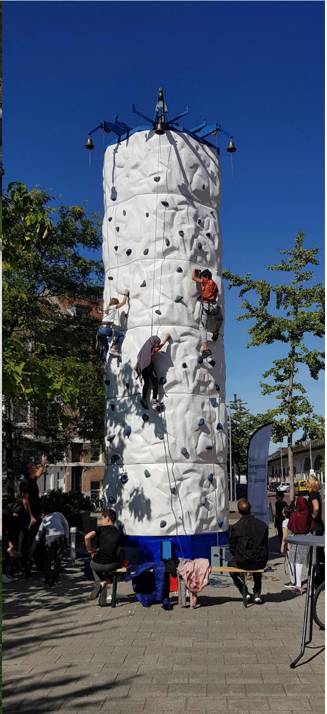
Kinderactiviteiten op de Tak van Poortvliet.