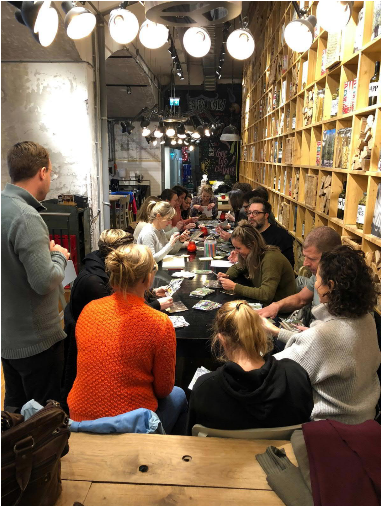
Workshop vergroeningsplan spoorpunt.

Met de stichting Tussentuin is op basis van een opdracht van water sensitive een workshop gehouden om een vergroeningsplan bij het Spoorpunt verder te ontwikkelen.