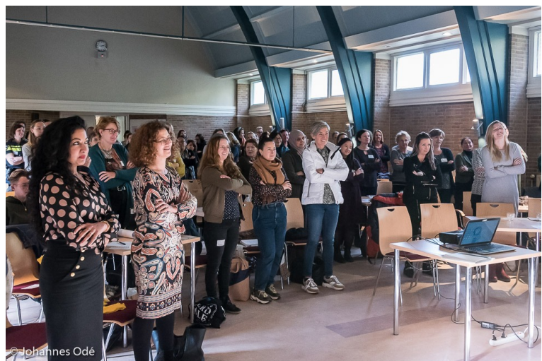
(Themabijeenkomst over huiselijk geweld en kindermishandeling)