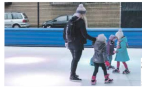
Een schaatsbaan als ontmoetingsplek (Koningsveldeplein).

Bewoners van het Oude Noorden houden de winterse gezelligheid nog even vast na de kerstvakantie. Zaterdag 12 januari is er een schaatsbaan op het Johan Idaplein. Ook zijn er creatieve activiteiten voor iedereen en bakken bewoners poffertjes. Kinderen krijgen de kans hun zang- en danstalenten te laten zien. Een bewonersinitiatief steunt dit pleinevenement. Samenkomen op pleinen is een manier om oude en nieuwe bewoners elkaar te laten ontmoeten. Dat houdt de sfeer erin in het Oude Noorden. Kom een kijkje nemen.