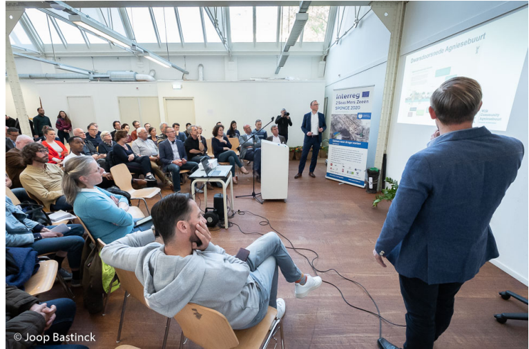
(Expertisetafel Agriesebuurt, zie meer op aanpakagriesebuurt.nl )