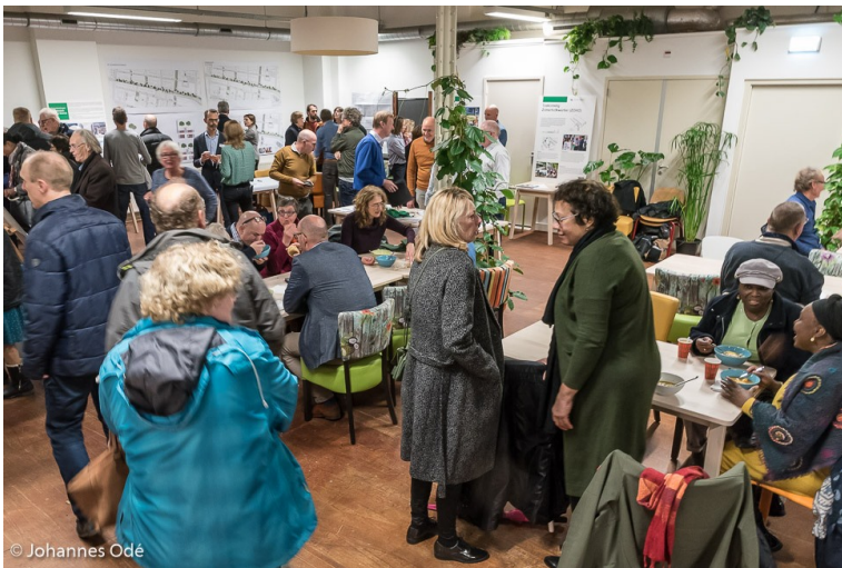
(Halfjaarlijkse bouw en ontwikkelingsmarkt grote en kleine projecten in de Agriesebuurt)