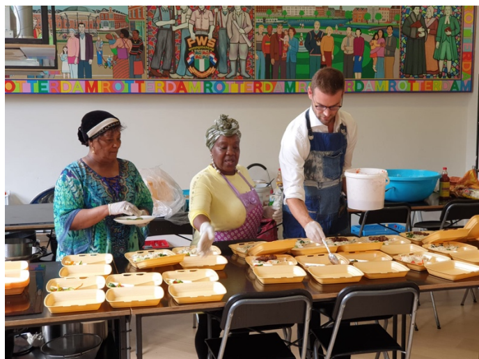
(Bezoek Wethouder de Lange – Start KookVoorJeBuur)