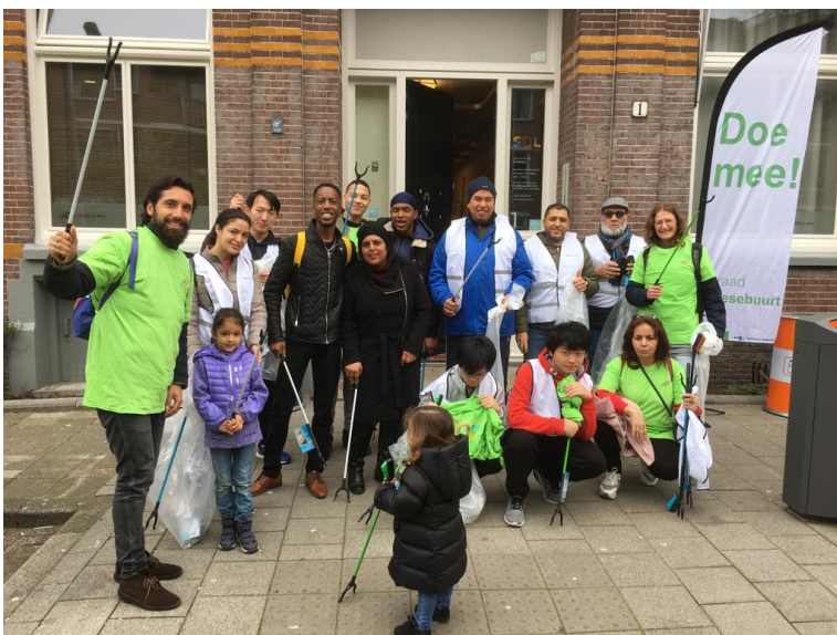
(Keep It Clean Day met bewoners en ondernemers)