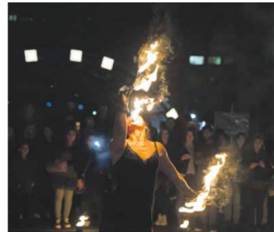
Bijzonder vuur in donkere dagen tijdens een ander vuurfestival.